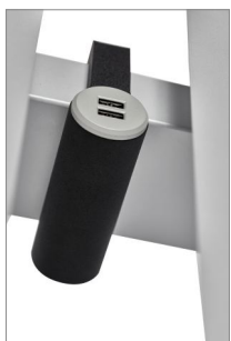
Gniazdko USB USB plug